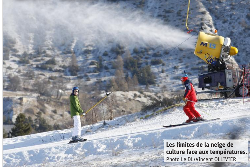
Les limites de la neige de culture face aux températures.

Ainsi, 175 stations, 129 dans les Alpes françaises, 28 dans les Pyrénées françaises (94 % des infrastructures hexagonales), mais aussi 18 en Espagne et Andorre, ont été passées au révélateur de la hausse du mercure : de +1,5 à 2 degrés, scénario le plus optimiste en matière de RCP (émission de gaz à effet de serre), à +5°, hypothèse qui se profile si l'humanité se laisse aller (RCP 8.5) sur la pente actuelle.